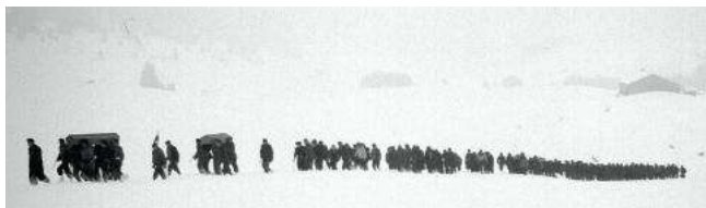
L'enterrement de Tom Morel et de Georges Decour sur le Plateau des Glières, le 13 mars 1944.