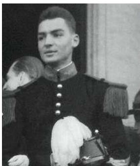
Jeune saint-cyrien de la promotion Maréchal Lyautey en 1935.

Après deux ans de scolarité, il se classe 16 e de sa promotion et choisit de servir au 27 e Bataillon de Chasseurs Alpins (27 e BCA) à Annecy. Il connaît bien la montagne pour l'avoir beaucoup pratiquée étant jeune. Elle sera un cadre exigeant et grandiose, à la mesure de ses aspirations.