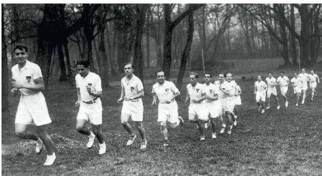
Passionné de sport, il est nommé capitaine d'athlétisme alors qu'il prépare Saint-Cyr à l'École Sainte Geneviève, Ginette, en 1934.