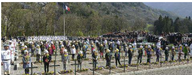
Les enfants des écoles et les chasseurs du 27 e BCA à la Nécropole de Morette lors de la célébration annuelle de l'anniversaire des combats des Glières.

Puisse son exemple inspirer tous ceux qui, civils et militaires, s'engagent au service de la France.