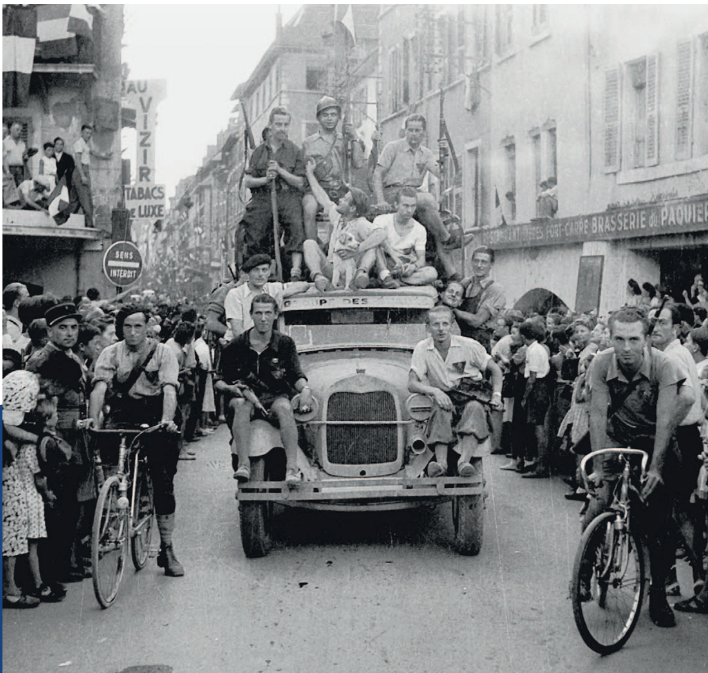
en haut Défilé de la victoire le 20 août 1944 dans les rues d'Annecy.