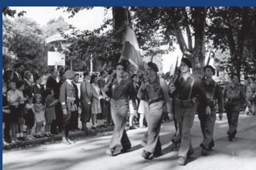
en bas 20 août 1944: les libérateurs A.S. et F.T.P. défilent avenue d'Albigny devant le commandant Godart.