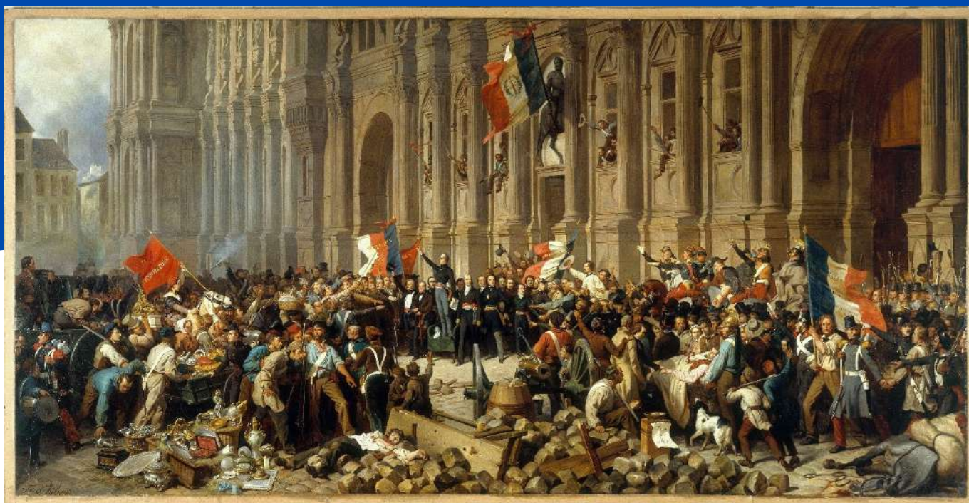
Lamartine repoussant le drapeau rouge à l'Hôtel de Ville, le 25 février 1848, Henri Félix Philippoteaux, 1848, Musée Carnavalet

Dès lors, le drapeau tricolore est définitivement adopté comme emblème de la France. En témoigne le tableau de Claude Monet, La rue Montorgueil à Paris - le 30 juin 1878 . Il représente la rue du centre de Paris pavoisée de drapeaux à l'occasion de la « fête de la paix et du travail », inaugurée par le gouvernement pour ancrer la République après la défaite de la guerre de 1870-1871. C'est en 1880 que le 14 juillet est décrété fête nationale française.