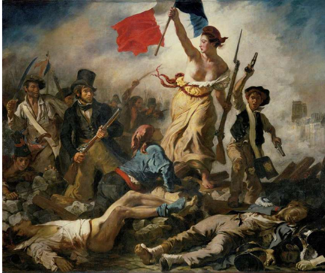
La liberté guidant le peuple , Eugène Delacroix, 1830, Musée du Louvre

C'est aussi le drapeau tricolore que porte Marianne dans le célèbre tableau d'Eugène Delacroix, peint la même année 1830, La Liberté guidant le peuple . Louis Philippe restaure le drapeau tricolore comme emblème national en 1830.