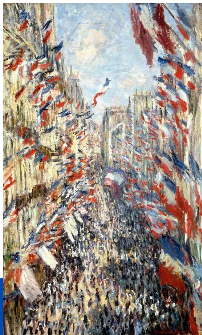
La rue Montorgueil à Paris - le 30 juin 1878, Claude Monet, 1878, Musée d'Orsay

Dès lors, le drapeau tricolore est définitivement adopté comme emblème de la France. En témoigne le tableau de Claude Monet, La rue Montorgueil à Paris - le 30 juin 1878 . Il représente la rue du centre de Paris pavoisée de drapeaux à l'occasion de la « fête de la paix et du travail », inaugurée par le gouvernement pour ancrer la République après la défaite de la guerre de 1870-1871. C'est en 1880 que le 14 juillet est décrété fête nationale française.