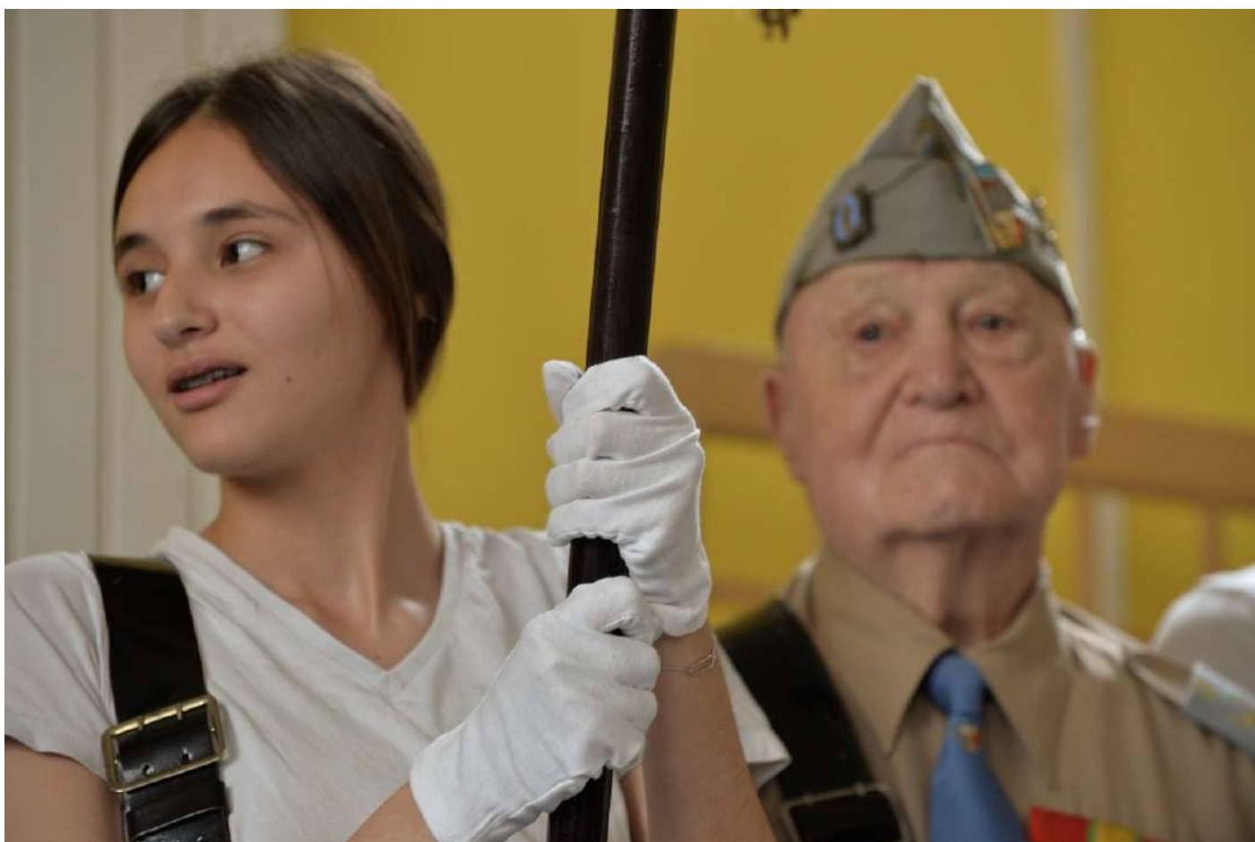
Cérémonie de dépôt du drapeau du CEFI au collège Boris Vian entre le dernier porte-drapeau de l'association et une collégienne porte-drapeau de son établissement.

Célébrer les hauts faits d'armes ou célébrer des événements sombres de notre histoire passe dans les deux cas par l'objet-drapeau qui peut être déposé dans les établissements scolaires. Les élèves peuvent étudier les inscriptions sur le drapeau et identifier les événements dont elles portent la mémoire. Le drapeau peut donc être utilisé en exemple pour aborder les conflits mondiaux du XXème siècle en classe. La cérémonie du dépôt de drapeau peut être l'occasion d'une rencontre intergénérationnelle avec les témoins de ces événements.