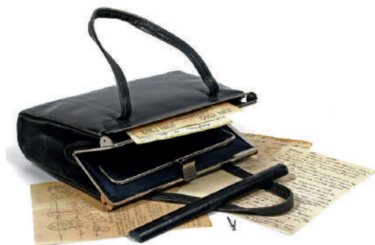
Sac à main à double-paroi de Lise London

Si le point de départ est donc l'espace privé, le propos de l'exposition s'élargit aux différents cercles de sociabilité qui ont pu favoriser l'entrée en Résistance des femmes. Il interroge aussi la pluralité des modalités d'action et les risques consentis par des femmes qui, comme l'a écrit l'historienne Dominique Veillon, ont «assumé leur devoir de citoyennes sans en avoir les droits».